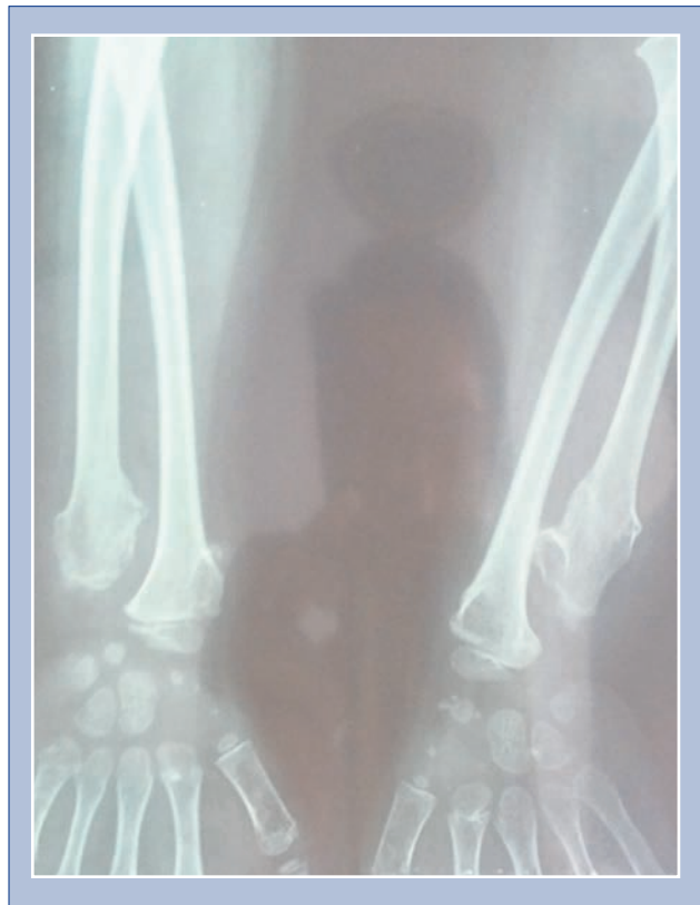
Fotografía No. 2: Encondromatosis múltiple o enfermedad de Ollier.