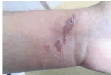
Foto No.3 Escara necrótica.

Caso No. 3: Paciente femenina, 36 años, secretaria, originaria de Guatemala Capital, consulto por mordedura de araña de 36 horas de evolución, quien indica que se encontraba limpiando la casa cuando una araña pequeña de color marrón la muerde, provocando intenso dolor, por lo que médico privado da tratamiento analgésico, no mejora por lo que consulta a Hospital General San Juan de Dios. Al examen físico: signos vitales normales, presencia placalivedoide de más o menos 2.5 cm de diámetro en cara lateral interna de antebrazo izquierdo (Foto No1), con extensión linfática a brazo izquierdo, leve edema y dolor de intensidad 7/10. Exámenes de laboratorio: Hematología, pruebas renales, hepáticas, tiempos de coagulación y orina, entro de límites normales.