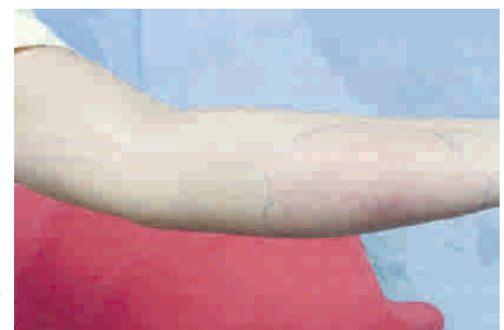
Foto No.1 Placalivedoide antebrazo.

Caso No. 3: Paciente femenina, 36 años, secretaria, originaria de Guatemala Capital, consulto por mordedura de araña de 36 horas de evolución, quien indica que se encontraba limpiando la casa cuando una araña pequeña de color marrón la muerde, provocando intenso dolor, por lo que médico privado da tratamiento analgésico, no mejora por lo que consulta a Hospital General San Juan de Dios. Al examen físico: signos vitales normales, presencia placalivedoide de más o menos 2.5 cm de diámetro en cara lateral interna de antebrazo izquierdo (Foto No1), con extensión linfática a brazo izquierdo, leve edema y dolor de intensidad 7/10. Exámenes de laboratorio: Hematología, pruebas renales, hepáticas, tiempos de coagulación y orina, entro de límites normales.