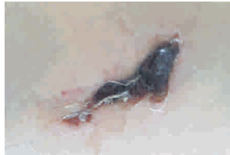
Foto No.3 Lesión necrótica.

Evolución: Paciente permanece estable desde su ingreso, dolor y edema disminuye considerablemente a las 48 horas, únicamente se prescribe inmunoglobulinas por 72 horas, a los 6 días se observa lesión necrótica, ya no hay induración de ganglios linfáticos, ni edema, pruebas hepáticas y CPK total hacia la normalidad por lo que se considera egreso (Foto No.3).