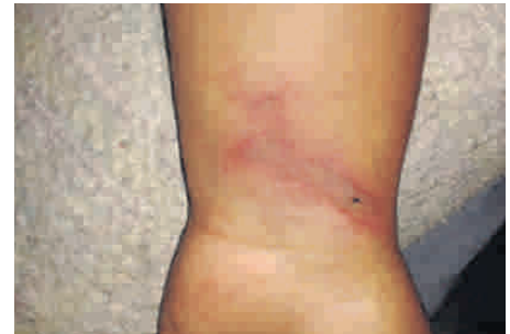
Foto No. 2 Lesión livedoide, con menos eritema perilesional.

En el quinto día se omiten esteroides y se da egreso. En el séptimo día se observa escara necrótica, no dolor (Foto No.3), se omiten antibiótico, dapsona y vitamina C.