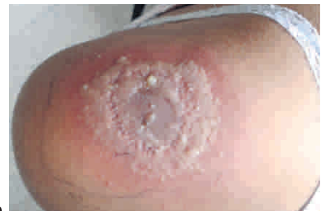
Foto No.2 Plalivedoide

Paciente permanece estable desde su ingreso, dolor disminuye considerablemente a las 24 horas, 3/10 (Foto No.2), se omiten soluciones IV, estando asintomática a partir del tercer día. No hubo aumento del tamaño de la lesión, ni del edema. En el quinto día se observa pequeña ulcera con adecuado tejido de granulación (Foto No.3), por lo que se omite esteroides y se da egreso, cumpliendo 7 días con tratamiento antibiótico, dapsona y vitamina C.