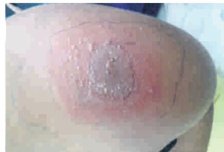
Foto No.1 Lesión puntiforme, pequeñas flictenas hemáticas y plalivedoide.

pero no tiene mejoría, inicia edema y dolor se intensifica a 8/10, por lo que consulta a Hospital General San Juan de Dios. Al examen físico: signos vitales normales, presenta en hombro izquierdo lesión puntiforme, con pequeñas flictenas hemáticas y base livedoide, área es de más o menos 7 cm de diámetro (Foto No.1). Exámenes de laboratorio: Hematología, pruebas renales, hepáticas, tiempos de coagulación y orina, dentro de límites normales. Al ingreso se inician medidas de sostén con hidratación con solución salina normal y Dapsona 50 mg PO cada 12 horas, Vitamina C 500 mg PO cada 24 horas, Metilprednisolona 15 mg IV cada 6 horas y antibioticoterapia con Oxacilina, además se delimita el área de lesión para valorar su comportamiento.