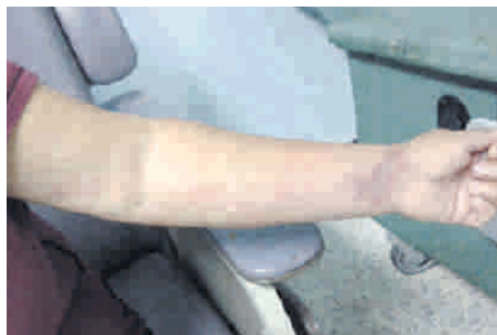
Foto No. 1 Extensión linfática.

Al examen físico: signos vitales normales, presenta a nivel de muñeca izquierda lesión livedoide, de más o menos 3x10 cms, con una pequeña área necrótica en uno de sus bordes, hay extensión eritematosa en cadena linfática de brazo izquierdo que compromete ganglios axilares y leve edema que llega a antebrazo y dolor de intensidad 8/10 (Foto No.1 y 2). Exámenes de laboratorio: Hematología, pruebas renales, hepáticas, tiempos de coagulación y orina, dentro de límites normales.