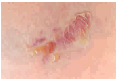
Foto No.1 Flictenas hemáticas y Placalivedoide

Caso No. 4: Paciente femenina, 35 años, originaria de Guatemala Capital, dependiente de mostrador, consulta por mordedura de araña de 3 días de evolución, indica que al colocarse la chumpa del trabajo sintió dolor fuerte en brazo derecho, no dando importancia, pero 1 día después el dolor se incrementa hasta no poder mover el brazo, además presenta edema y malestar general, por lo que decide consultar a Hospital General San Juan de Dios. Al examen físico: signos vitales normales, presencia de flictenas hemáticas y placalivedoide de más o menos 3 x 13 cm en cara interna de brazo derecho, además de eritema e induración de más o menos 13 x 35 cm, con presencia de edema moderado e induración de ganglios linfáticos axilares (Foto No. 1, 2). Exámenes de laboratorio: Presencia de leucocitosis con neutrofilia, elevación de pruebas hepáticas [TGO: 133 U/L (15-46), TGP: 129 U/L (11-66), BBSS: 1.7 mg/dl (0.2-1.2) expensas de directa, GGT: 163 U/L (9-36)] y CPK total: 360 U/L (29-168), tiempos de coagulación, orina y USG hepático entre límites normales.